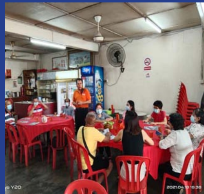
18 APRIL 2021 - MPP ZON 4 Jamuan Mesra Dengan Ahli-Ahli Cawangan DAP Bandar Baru Teluk Panglima Garang