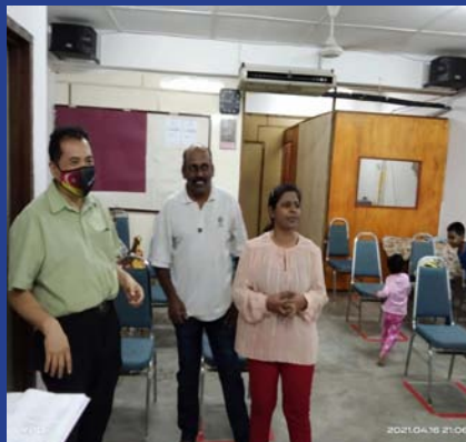
16 APRIL 2021 - MPP ZON 4 Bantuan Khas COVID-19 Kepada Komuniti India