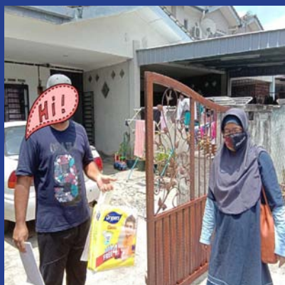
18 APRIL 2021 - MPP ZON 1 Sumbangan Pampers Dan Ayam Segar