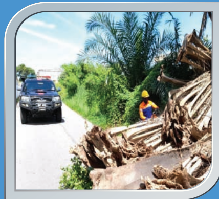
21 Jun 2021 Pokok Tumbang Di Taman Gembira

Penerbitan buletin ini dikhususkan kepada pembaca Sektor Kerajaan, Badan Bukan Kerajaan, Institusi Pengajian Tinggi Awam dan Swasta di seluruh negara dan edaran secara percuma.