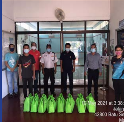
10 MEI 2021 - MPP ZON 24 Sumbangan Ihya Ramadhan