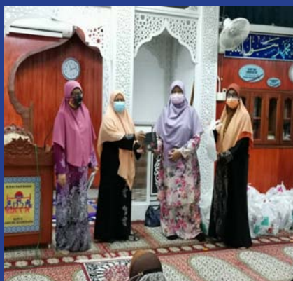
1 MEI 2021 - MPP ZON 1 Program Tadarus & Khatam Perdana