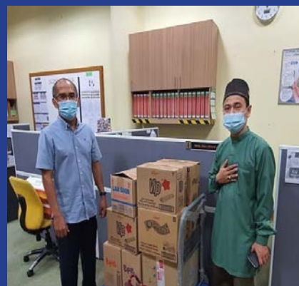
8 MEI 2021 Penyerahan Coklat untuk Warga Masjid