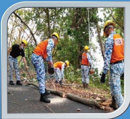
5 April 2021 Pokok Tumbang Di Jalan Bukit Jugra