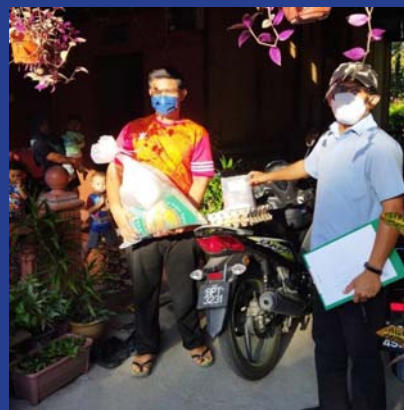
30 JUN 2021 Bantuan Bakul Makanan Covid-19