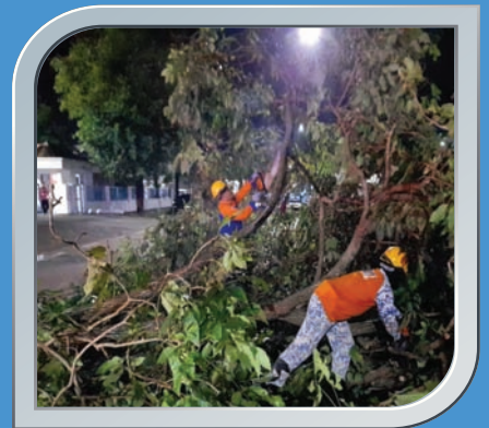
3 Mei 2021 Pokok Tumbang Di Banting