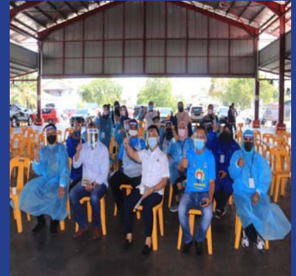
11 MEI 2021 - MPP ZON 24 Swab Test PCR Komuniti Anjuran Jawatankuasa Anti COVID