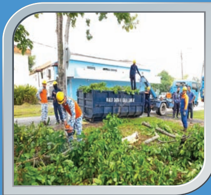
8 April 2021 Pokok Tumbang Di Taman Seri Jugra