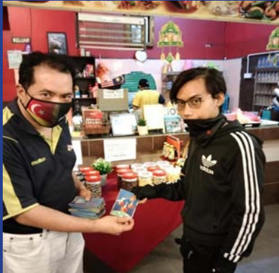
5 MEI 2021 - MPP ZON 4 Pengagihan Sampul Duit Raya Kepada Peniaga-Peniaga Bazar Ramadhan