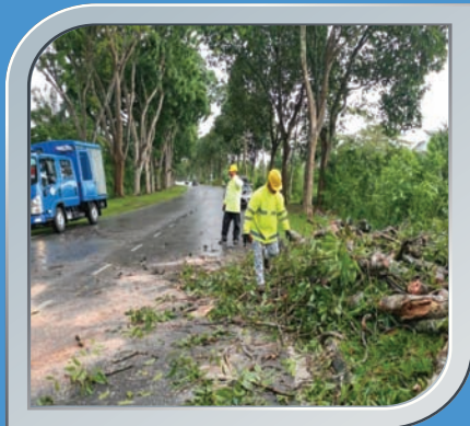
21 Mei 2021 Pokok Tumbang Di TKampung Sawah