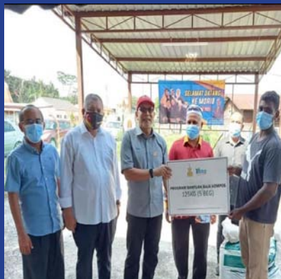
1 APRIL 2021 Serahan Baja di MPKK Permatang Pasir