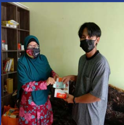
27 JUN 2021 - MPP ZON 1 Program Hadiah Kecemerlangan SPM STAM 2020