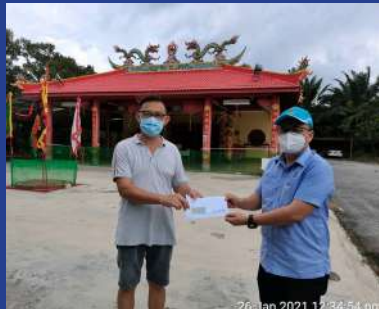
26 JANUARI 2021 - MPP ZON 19 Sumbangan Bantuan Kemanusiaan Sempena Tahun Baru Cina kepada Persatuan Penganut Dewa Hock Lock Tong Banting, Kuala Langat