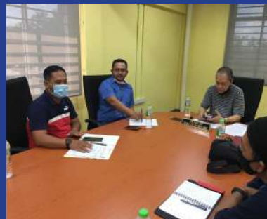
13 MAC 2021 - MPP ZON 7 Mesyuarat MPP ZON 7 Bil 1 Tahun 2021