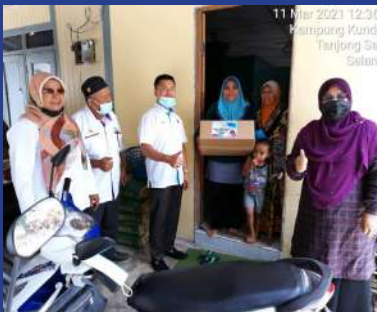
11 MAC 2021 Sumbangan COVID-19