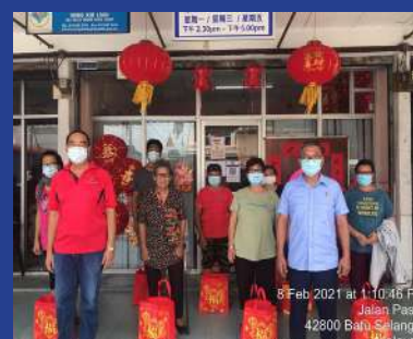
8 FEBRUARI 2021 Program Sumbangan Bantuan Sempena Tahun Baru Cina 2021