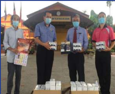
20 JANUARI 2021 Sumbangan 5000 3-Ply Medical Masks Kepada Anak Murid SMK Teluk Panglima Garang