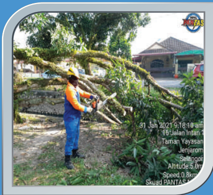
31 Januari 2021 Pokok Tumbang Di Jalan Intan Sungai Jarum