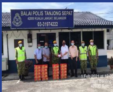
1 FEBRUARI 2021 Program Agihan Limau Sempena Tahun Baru Cina 2021