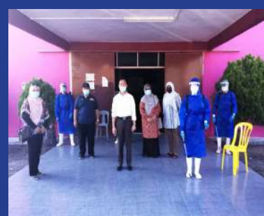
24 FEBRUARI 2021 Sanitasi Kawasan Sekolah Menengah Kebangsaan Batu Laut