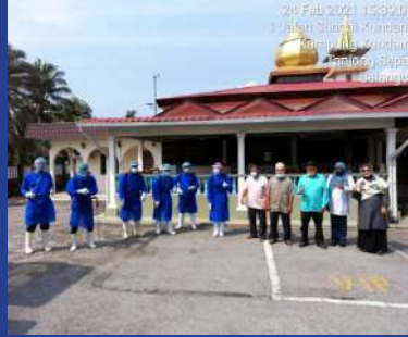
28 FEBRUARI 2021 Sanitasi Masjid Kampung Kundang