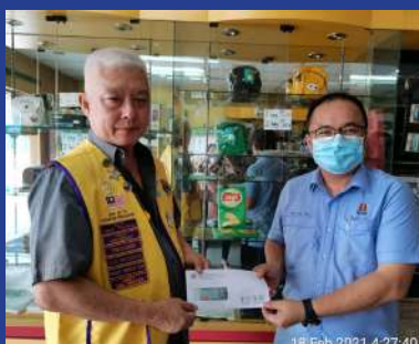
18 FEBRUARI 2021 - MPP ZON 19 Sumbangan Kewangan Untuk Gerak Kerja Lions Club of Kuala Langat Central