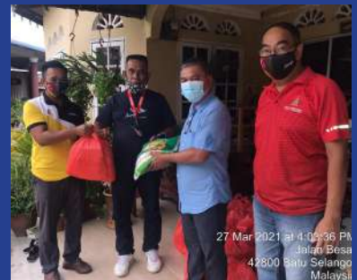
27 MAC 2021 Program Bantuan COVID-19