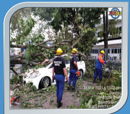
16 Mac 2021 Pokok Tumbang Di Banting

Penerbitan buletin ini dikhususkan kepada pembaca Sektor Kerajaan, Badan Bukan Kerajaan, Institusi Pengajian Tinggi Awam dan Swasta di seluruh negara dan edaran secara percuma.