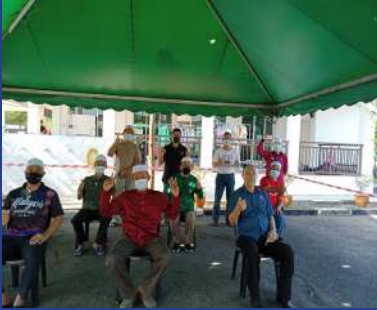
28 FEBRUARI 2021 Kempen Sumbangan Pakaian Dan Kelengkapan Sekolah "Give And Take"