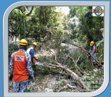
17 Februari 2021 Pokok Tumbang Di Bukit Jugra