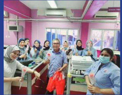
8 MAC 2021 Program Hari Wanita Sedunia 2021