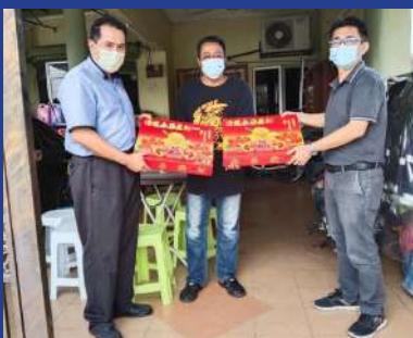
28 JANUARI 2021 Mesra Dengan Ketua JKKK Taman Palas