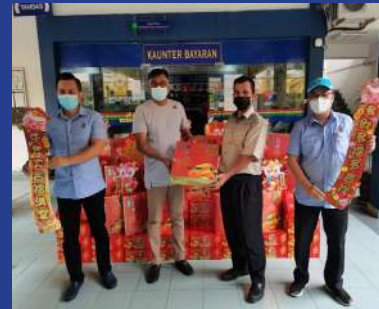
27 JANUARI 2021 Program Mesra Rakyat Sempena Tahun Baru Cina 2021