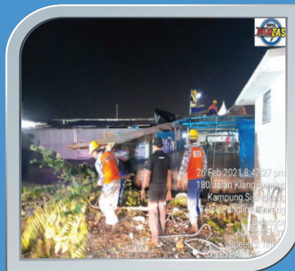
26 Februari 2021 Pokok Tumbang Di Telok Panglima Garang