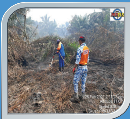
25 Februari 2021 Kebakaran Hutan Di Sungai Pelek