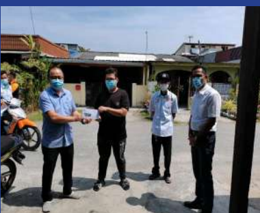
9 FEBRUARI 2021 - MPP ZON 19 Sumbangan Kewangan Untuk Mangsa Ribut