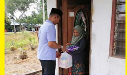
ZIARAH KASIH MPP ZON 3 3 MAC 2020 - MPP ZON 5