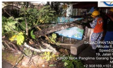
Pokok Tumbang Taman Dato Hormat 6 Januari 2020