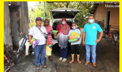
SUMBANGAN PERUNTUKAN KHAS MCO 14 APRIL 2020 - MPP ZON 24