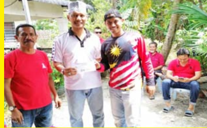
PERTANDINGAN MEMANCING TERTUTUP SG RAMBAI MPP ZON 5 5 FEBRUARI 2020 - MPP ZON 5