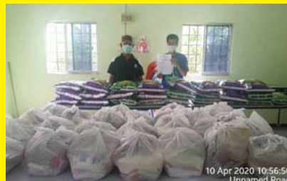
PROGRAM COVID-19 10 APRIL 2020 - MPP ZON 16