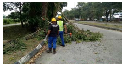
Pokok Sekah & Halang Laluan Jalan Utama Pasar Banting 9 Mac 2020

Penerbitan buletin ini dikhususkan kepada pembaca Sektor Kerajaan, Badan Bukan Kerajaan, Institusi Pengajian Tinggi Awam dan Swasta di seluruh negara dan edaran secara percuma.