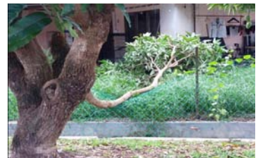
Dahan Sekah Taman Budiman 8 Januari 2020