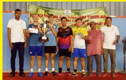
KEJOHANAN BADMINTON TERBUKA MPP ZON 7