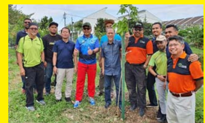
PROGRAM PEMULIHARAAN LEBAH & PENANAMAN SEMULA POKOK MPP ZON 7