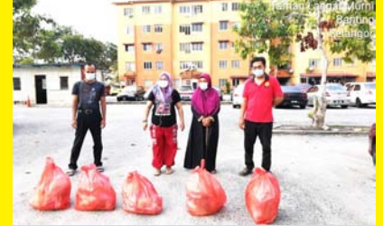
SUMBANGAN COVID-19 TAMAN LANGAT MURNI 19 APRIL 2020 - MPP ZON 12