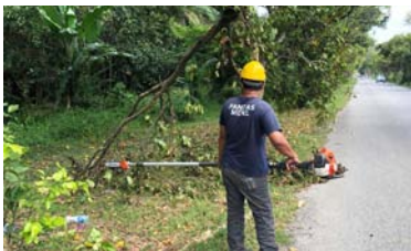
Pokok Tumbang Bandar Seri Ehsan 4 Januari 2020