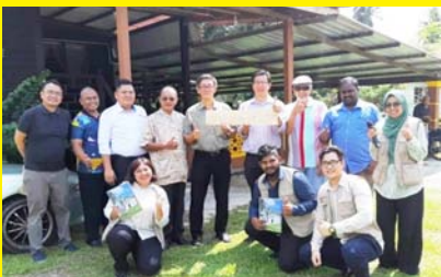
BANDAR TEMASYA WALK BERSAMA HOS KOMUNITI KUALA LANGAT 8 JANUARI 2020 - MPP ZON 11