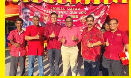
RUMAH TERBUKA TAHUN BARU CINA 2019 ANJURAN BERSAMA MPP ZON 1, 6, 10, 11, 14, 17 & 21 25 JANUARI 2020 - MPP ZON 11