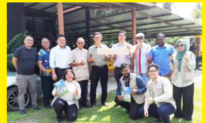
PERTANDINGAN MEMANCING SUNGAI LANGAT 2.0 ANJURAN MPP ZON 11 & 21, KRT BSE 1 MAC 2020 - MPP ZON 11