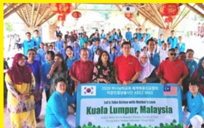
KEMPEN ZERO PLASTIK DI TADOM HILL MPP ZON 11 & 21 17 JANUARI 2020 - MPP ZON 11