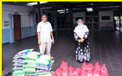
SUMBANGAN COVID-19 ASNAF TAMAN CHANGGANG JAYA FASA 1 23 APRIL 2020 - MPP ZON 12