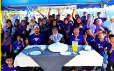
HARI KELUARGA TAMAN CHANGGANG JAYA FASA 3 29 FEBRUARI 2020 - MPP ZON 12