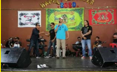
PROGRAM SEMARAK TAHUN BAHARU 2020 MALAYSIA - INDONESIA 1 JANUARI 2020 - MPP ZON 5