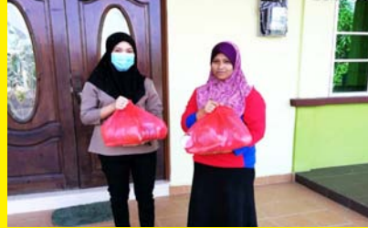
SUMBANGAN COVID-19 ASNAF TAMAN MURNI 10 APRIL 2020 - MPP ZON 12