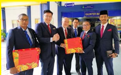
PROGRAM PENGAGIHAN BUAH LIMAU 21 JANUARI 2020 - MPP ZON 24