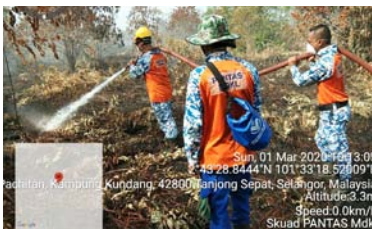
Kebakaran Hutan Simpan kekal Kuala Langat Selatan 28- 29 Februari 2020