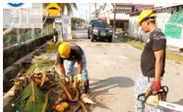
Pokok Tumbang Jalan Pasar Tg. Sepat 9 Mac 2020