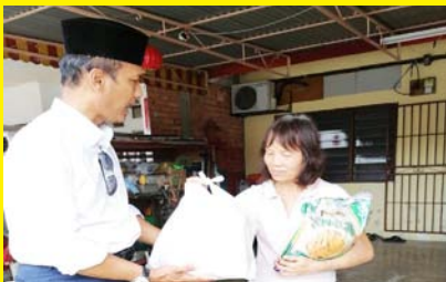
ZIARAH KASIH PASCA COVID-19 23 MAC 2020 - MPP ZON 5