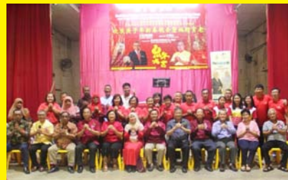
SAMBUTAN CHINESE NEW YEAR OPEN HOUSE 1 FEBRUARI 2020 - MPP ZON 24