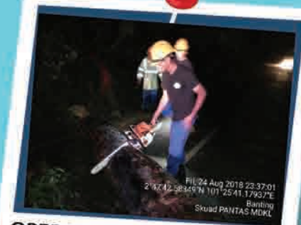
OPERASI POKOK TUMBANG DI SEKITAR KUALA LANGAT 24 OGOS 2018