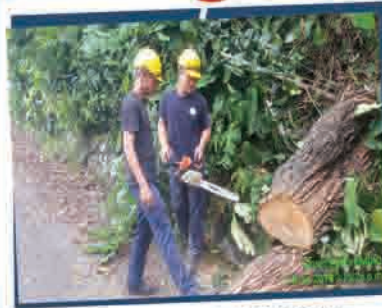
POKOK TUMBANG & HALANG LALUAN 18 JULAI 2018