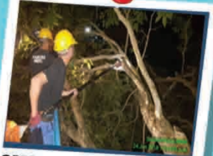
OPERASI POKOK TUMBANG DI SEKITAR KUALA LANGAT 17 SEPTEMBER 2018

Penerbitan buletin ini dikhususkan kepada pembaca Sektor Kerajaan, Badan Bukan Kerajaan, Institusi Pengajian Tinggi Awam dan Swasta di seluruh negara dan edaran secara percuma.