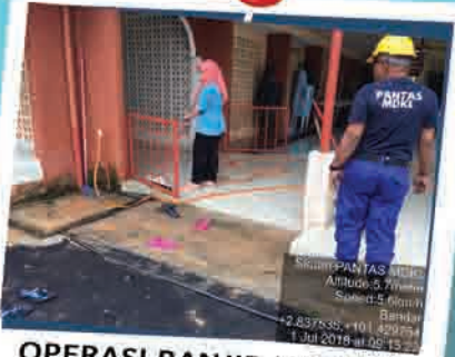
OPERASI BANJIR LUMPUR DI KG PERMATANG PASIR 1 JULAI 2018