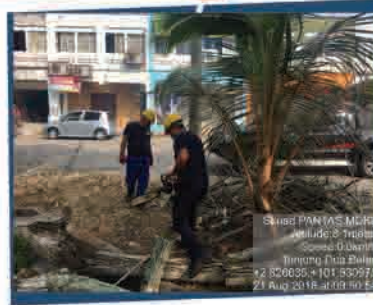
OPERASI POKOK TUMBANG DI TAMAN MANGGIS JAYA 21 OGOS 2018