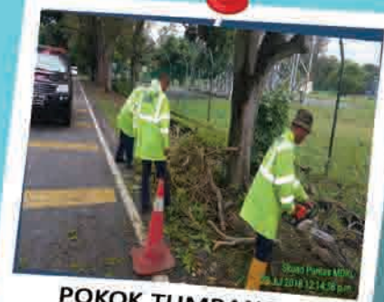
POKOK TUMBANG & HALANG LALUAN 23 JULAI 2018