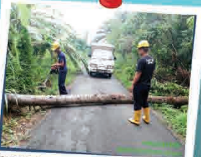
OPERASI POKOK TUMBANG DI TAMAN DELIMA 6 SEPTEMBER 2018