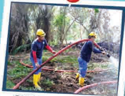
OPERASI MEMADAM KEBAKARAN DI JALAN SUKEPI 15 OGOS 2018