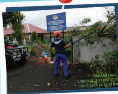
Pokok Tumbang 23 Mei 2018