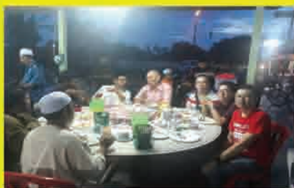
MPP 19 Gan Yee Chin Program Berbuka Puasa Bandar Mahkota