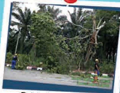
Pokok Tumbang & Menghalang Laluan 21 Mei 2018