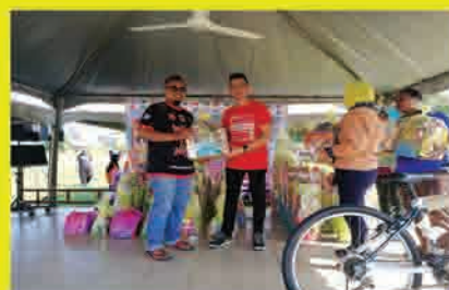
MPP 19 Gan Yee Chin Program Edaran Buah Kurma Bandar Mahkota