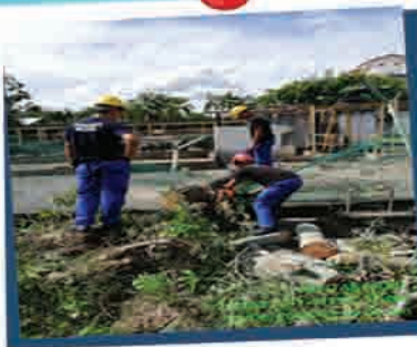
Pokok Tumbang & Menghalang Laluan 19 Jun 2018