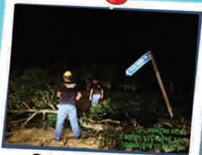
Pokok Tumbang & Menghalang Laluan 18 Jun 2018