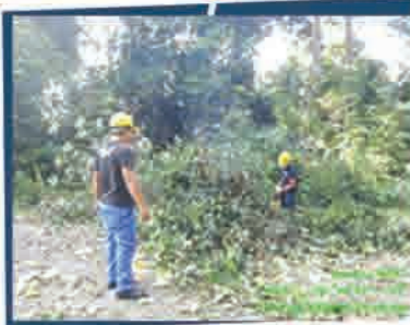
Pokok Tumbang & Menghalang Laluan 21 April 2018