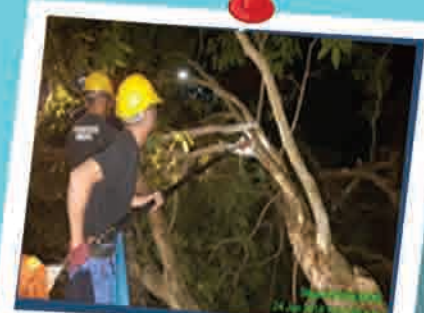
Pokok Tumbang 24 Jun 2018

Penerbitan buletin ini dikhususkan kepada pembaca Sektor Kerajaan, Badan Bukan Kerajaan, Institusi Pengajian Tinggi Awam dan Swasta di seluruh negara dan edaran secara percuma.