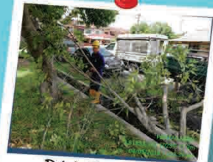
Pokok Tumbang & Menghalang Laluan 4 Mei 2018