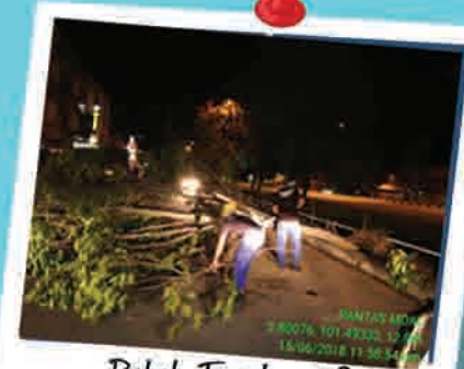
Pokok Tumbang & Menghalang Laluan 16 Jun 2018