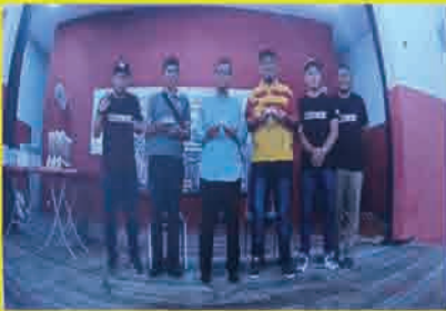
MPP 5 Ab Rahman b. Amir Road Tour Hotwheels Race TPG Challenge 2018