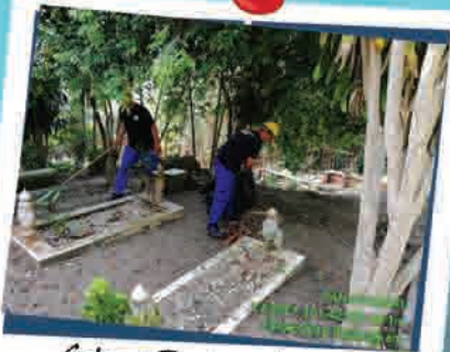
Gotong Royong Makam Di Raja Jura 19 April 2018