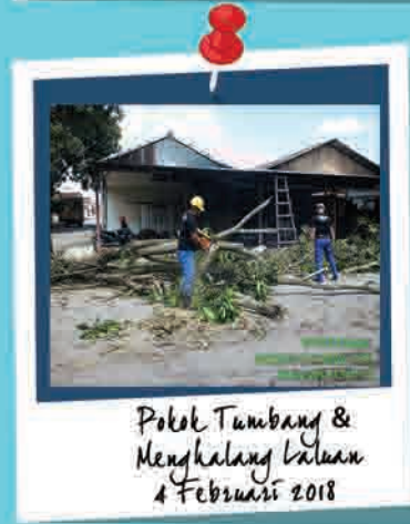
Pokok Tumbang & Menghalang Laluan 4 Februari 2018