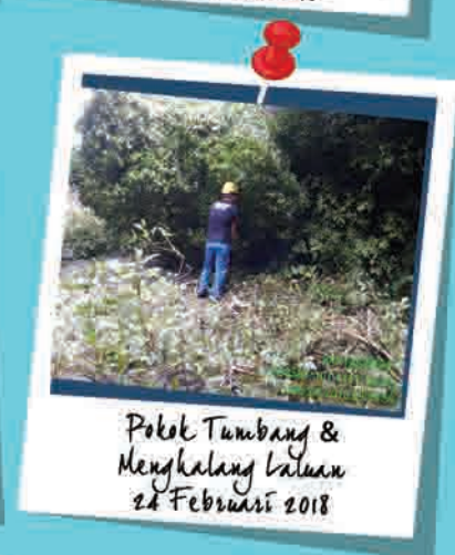
Pokok Tumbang & Menghalang Laluan 24 Februari 2018