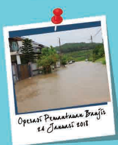
Operasi Pemantauan Banjir 24 Januari 2018