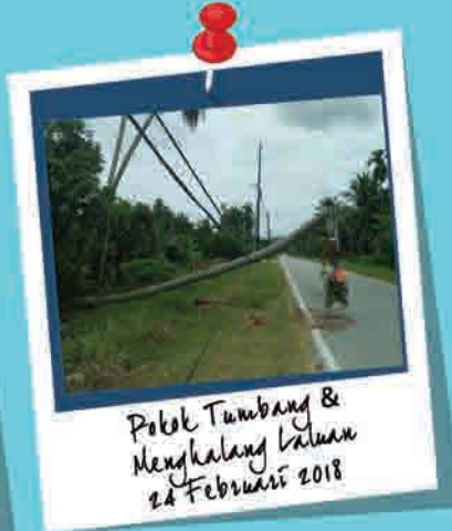
Pokok Tumbang & Menghalang Laluan 24 Februari 2018

Penerbitan buletin ini dikhususkan kepada pembaca Sektor Kerajaan, Badan Bukan Kerajaan, Institusi Pengajian Tinggi Awam dan Swasta di seluruh negara dan edaran secara percuma.