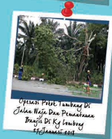
Operasi Pokok Tumbang Di Jalan Waja Dan Pemantauan Banjir Di Kg Lombong 27 Januari 2018