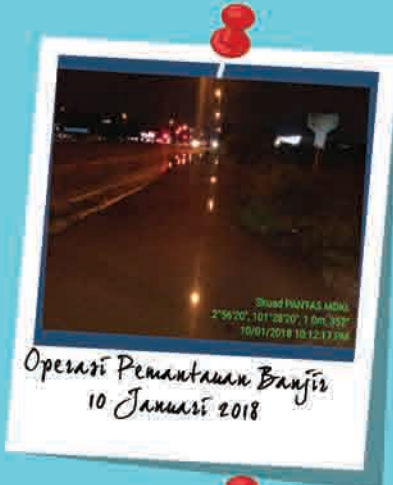
Operasi Pemantauan Banjir 10 Januari 2018