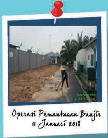
Operasi Pemantauan Banjir 11 Januari 2018